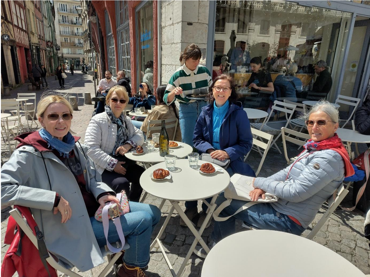
Foto aus Rouen