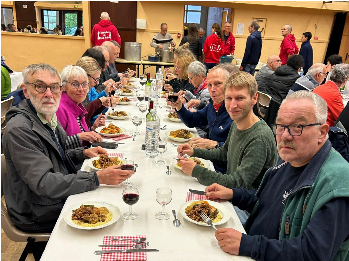
Foto vom Couscous-Essen

Auch ansonsten hatte Gournay kulinarisch einiges zu bieten. Zwar fanden wir kein typisch französisches Restaurant, konnten es uns dafür aber bei Pizza und Burgern gut gehen lassen. Im „Ô Bistrot“ oder „Chez Nico“ bestand zudem die Möglichkeit, die Abende bei dem ein oder anderen Bier, Wein oder Cocktail gemütlich ausklingen zu lassen.