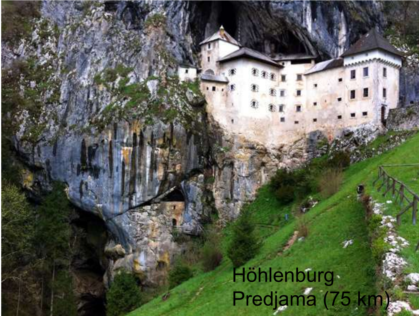
Höhlenburg Predjama (75 km)